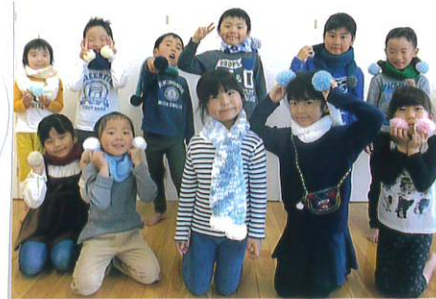
卒園製作「マフラー」

5月17日(日) みんなで楽しもう! 予定しています! ひだまりの会&オヤジの会主催 保育園の園庭にて *詳細は後日お知らせいたします。