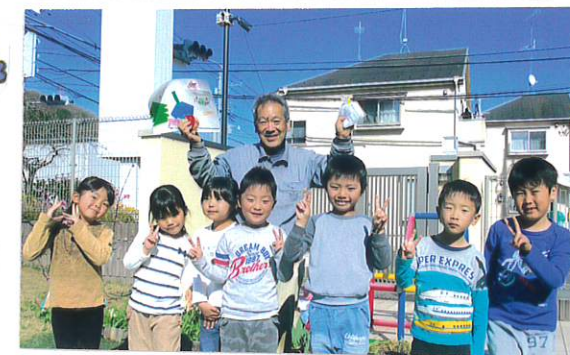
林さん美味しいお野菜ありがとう!